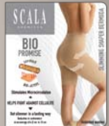
Anti Cellulite Shapewear / Niedriger Bund Nahtlos und verstärkt. Perfekt unter Rücken, Jeans und anderen Hosen.