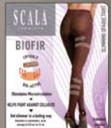
Slimming Opaque Strumpfhose Eine elegante Strumpfhose für Alltag und festliche Anlässe.