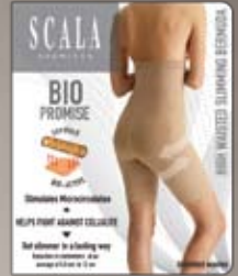
Anti Cellulite Shapewear / Hoher Bund Nahtlos und verstärkt. Wirkt auch oberhalb der Taille und sorgt für eine schöne Silhouette, zum Beispiel unter einem figurbetonen Kleid.