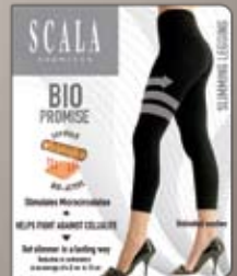
Anti Cellulite Shapewear Leggings Nahtlos und verstärkt. Schicke Leggings, auch fürs Training ideal.